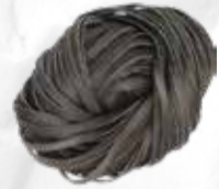
TAGLIATELLI NERO DI SEPIA