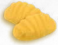
GNOCCHIS DI PATATA