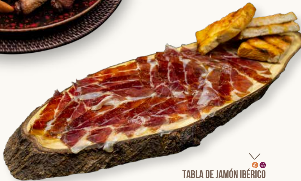
TABLA DE JAMÓN IBÉRICO

Jamón ibérico sobre pan cantábrico con tomate Iberian ham with cantabrian bread with tomato Jambon ibérique avec pain cantrabric avec tomat Хамон иберико и поджаренный хлеб с томатом